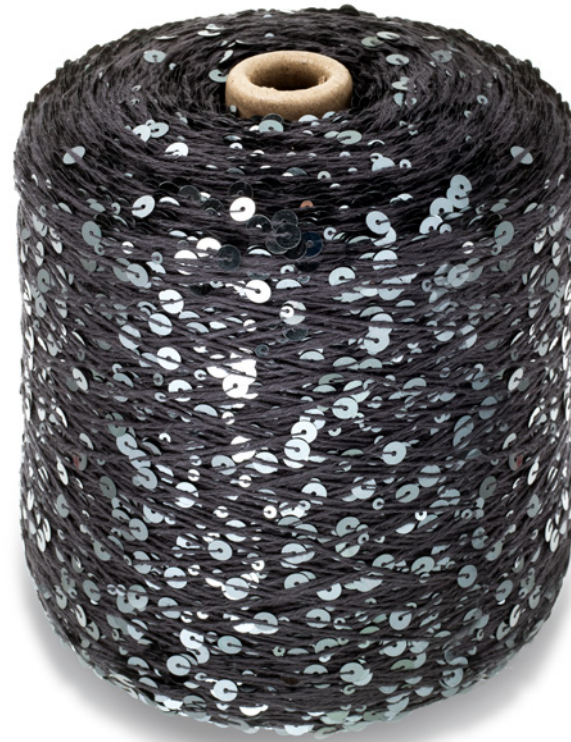
Beispiel für Effektgarn: Paillettengarn